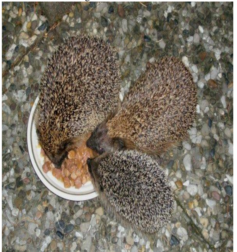
Oktober Aus Versehen habe ich nun den ASUS 1000H gekauft und anstatt ihn umgehend zurückzugeben, habe ich ihn behalten und bin sehr zufrieden. Akkumulatorenlaufzeit: 4 Stunden.....und da sind unsere neuen Pflegekinder, drei Igel, welche wir fit für den Winter mit Unmengen von Hundefutter gemästet haben. Hinter dem Komposthaufen habe ich ein Höhlensystem angelegt, dort schlafen sie jetzt....