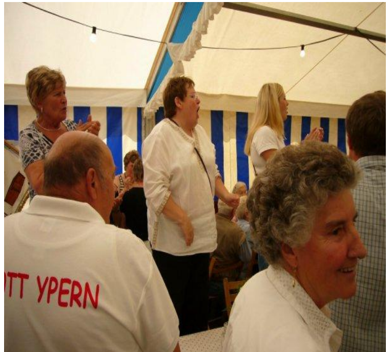
September Die Erntekrone von Haste, sie wird jedes Jahr gebührend gefeiert...so wie man es hier sehen kann. Die Dame, welche hier auf einen Stuhl geklettert ist, ist die erste Vorsitzende meines Gesangsvereins....