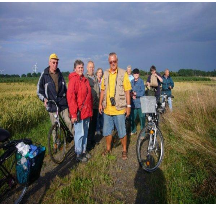
Juli Eine Radtour mit einigen unentwegten Leuten aus dem Gesangsverein, der etwas zu leicht bekleidete Herr in der Mitte bin ich.....und so kann eine Fernfahrraststätte aussehen, Hundertwasser lässt grüßen. Beobachtet anlässlich meiner großen Motorradtour nach Italien, hier in der Schweiz...