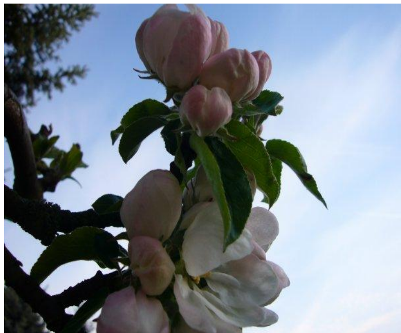
April Melanie versucht sich mal mit Tennis....ich fotografiere Apfelblüten....