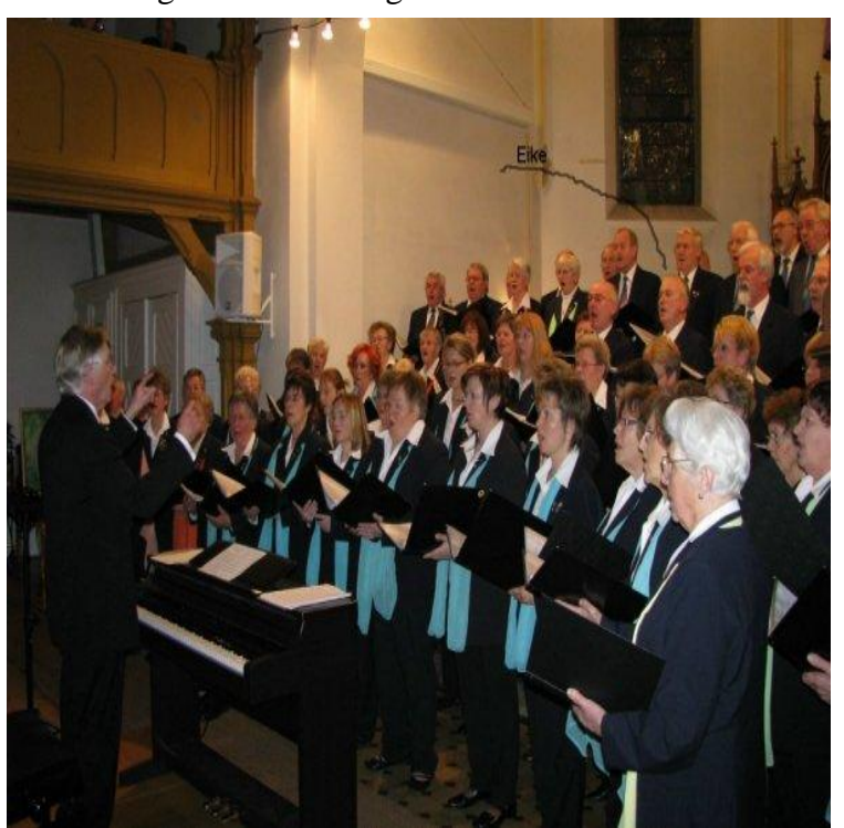
Dezember Wer mal reinen Jugendstil sehen möchte, der fahre nach Herford und gehe in das große Cafe´ am Markt...und nun unser Weihnachtskonzert in der Martinskirche zu Hohnhorst. Damit Ihr mich besser erkennen könnt, habe ich meinen Namen und einen Wegweiser auf meine Person gezeichnet. Ich singe im Bass, wie sich das auch für einen älteren Herren gehört. Wer noch mehr über diesen Gesangsverein wissen möchte, bitteschön: