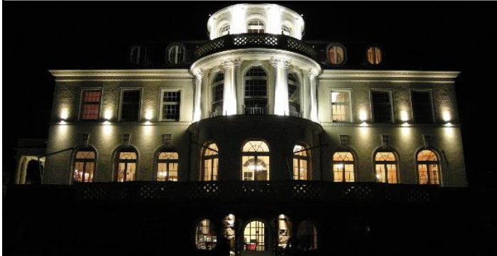
Vizechorleiter-Seminar in der Villa Dürkopp (Nähmaschinen, Fahrräder, Motorräder etc.), reiner Jugendstil, ein erlebnisreiches Wochenende in Bad Salzungen