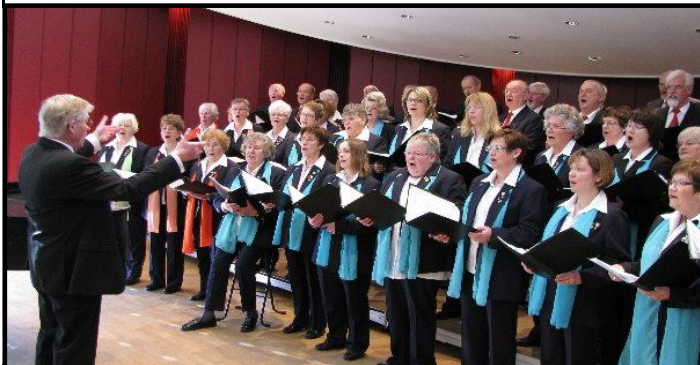
Unser Benefizkonzert in der Wandelhalle in Bad Nenndorf, ich singe im Bass, letzte Reihe, der zweite von rechts...