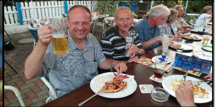
Das Ende einer der drei Fahrradtouren mit dem Gesangsverein. Mit guten Freunden feiern wir im Calabria, unserem "Italienischen Restaurant"