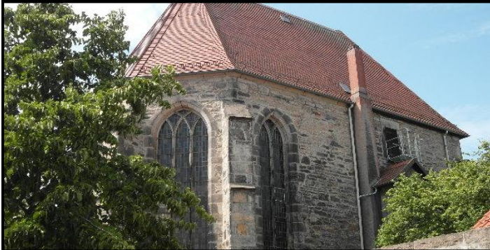
Die Kapelle der Wittenburg, ein Kleinod bei Sorsum, meinem Wohnort von 1945 bis 1953, nahe bei Elze, Kreis Hildesheim