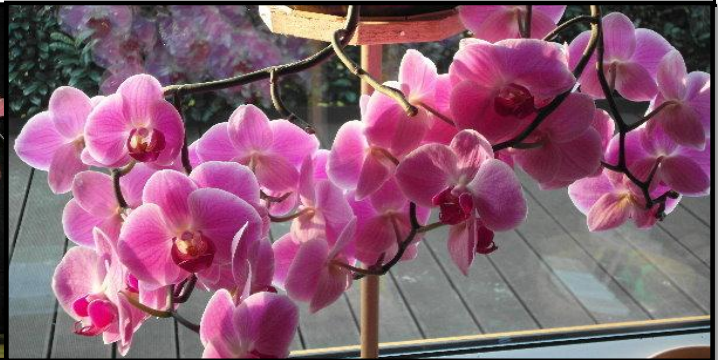
Hat schon jemand im Urwald Orchideen an Stäben gebunden gesehen? Aus dieser Erkenntnis heraus hängen meine Orchideen jetzt und lohnen es mit solcher Blütenpracht..