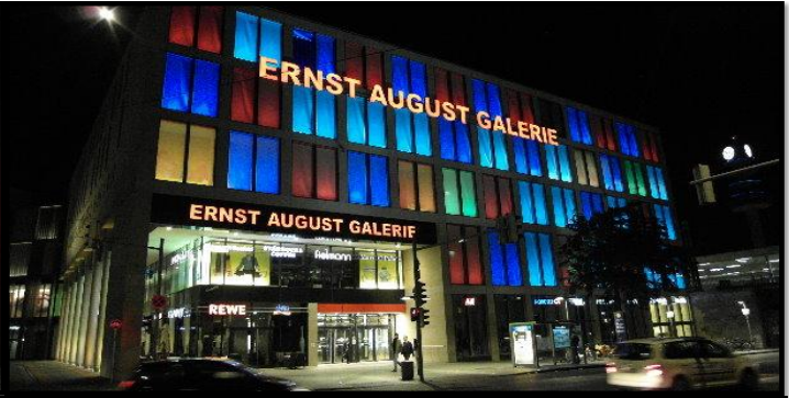
Da kommt man leicht angeheitert aus dem Brunnenhof in Hannover, strebt dem Bahnhof zu und macht so nebenbei diese Nachtaufnahme, unser König Ernst August hätte sich gefreut...