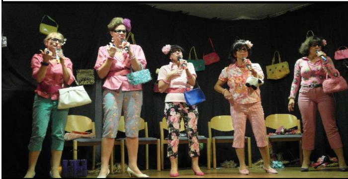
Herzen in Terzen, ein singendes Frauenquintett, nicht nur für Frauen begeisternd, ein Auftritt bei uns in Haste im Bürgerhaus -- http://www.herzen-in-terzen.de/