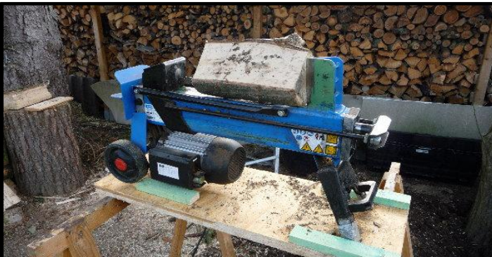
Wer es warm haben möchte, muss beizeiten Holz "machen", hier mein Spalter, im Hintergrund ein Teil der 21 Raummeter. Heizölverbrauch dadurch: 700 L / Jahr