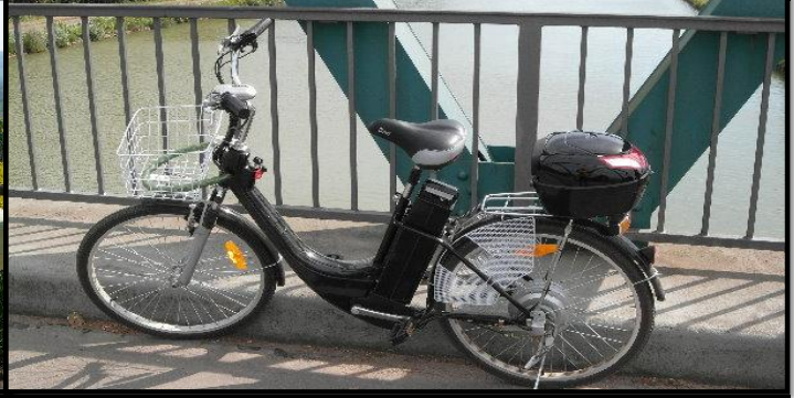
Ja, ein E-Rad, Bleiakкумуляtor mit einer Energiespeicherung von 360 Joule. Preis: 399€ - Funktioniert ohne Probleme...Herkunft: China