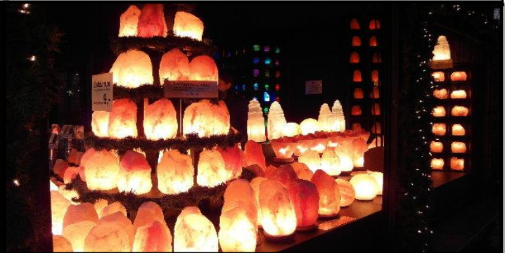
Der Weihnachtsmarkt in Lüneburg, dank Dieter Krause vom Siedlerbund wurde dieser schöne Mittwoch erlebt..