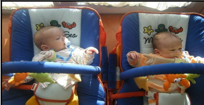
Oriol und Unai, meine beiden Enkel, jetzt fast ein halbes Jahr alt, lebend auf der Insel Gomera