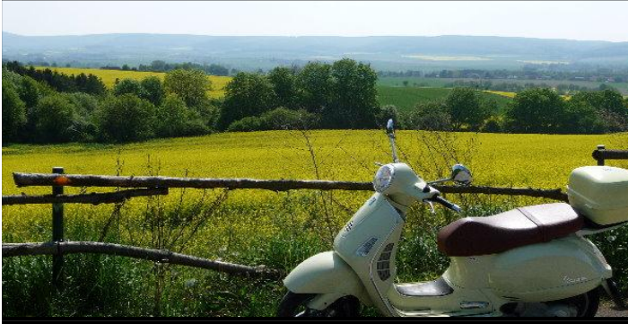
Malanies Motorroller, aber fast nur von mir gefahren, die blühenden Rapsfelder locken mich zum Fotografieren..