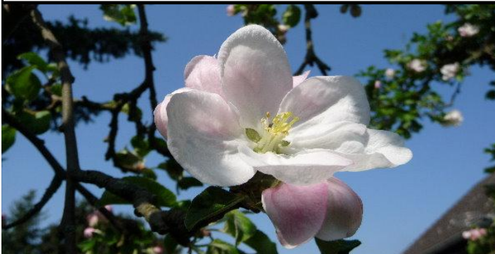
Und immer wieder blüht der Apfelbaum in unserem Garten, auf ihn ist verlass...