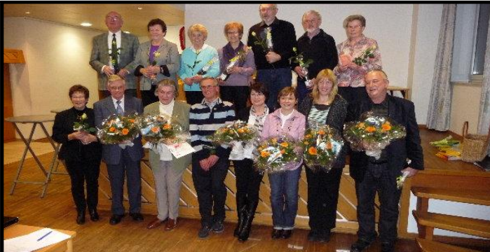
Und auch ich erhalte einen Strauss Blumen auf der Jahreshauptversammlung des Gesangsvereins für meine Tätigkeit als Ersteller des Internetauftrittes.. http://www.eisenbahnchor-haste.de/ ...vorne, ganz rechts