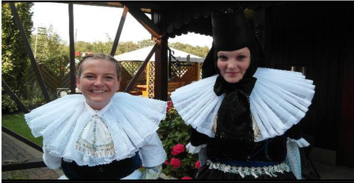
Und immer noch wird bei uns die Schaumburger Tracht lebendig gehalten, hier zu unserem Erntefest in Haste..