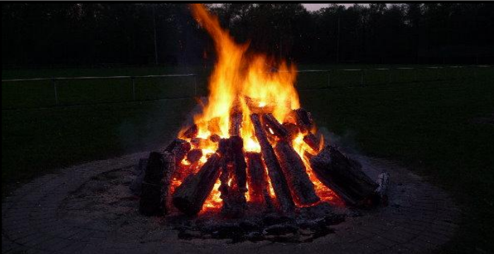
Wie jedes Jahr veranstaltet das Rott Ypern einn Osterfeuer und ich bin mit dabei...