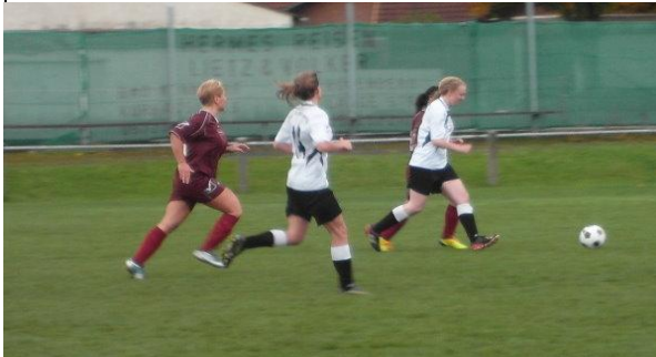
Mit Begeisterung spielt meine Frau jetzt Fussball, hier ganz links...