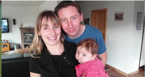
Und so zieht in mein Elternhaus wieder neues Leben ein, die Kette reisst nicht ab...