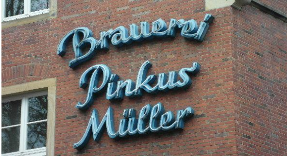
Münster (W), Pinkus Müller, ein "Muss"...