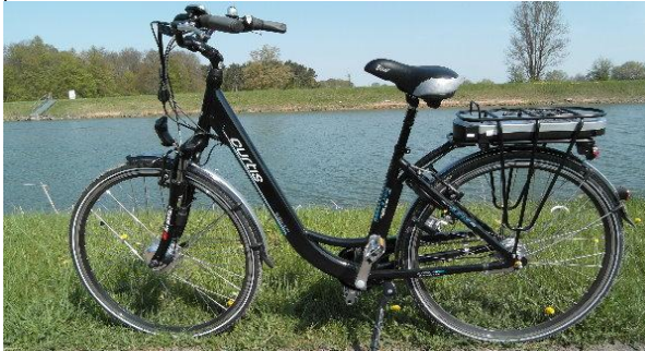
Wer einmal mit elektrischer Energie gefahren ist, möchte es nicht mehr missen, hier am Mittellandkanal