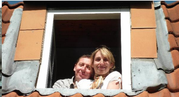
Mein Neffe mit seiner Braut, das Leben geht weiter, jetzt sind sie zu dritt...