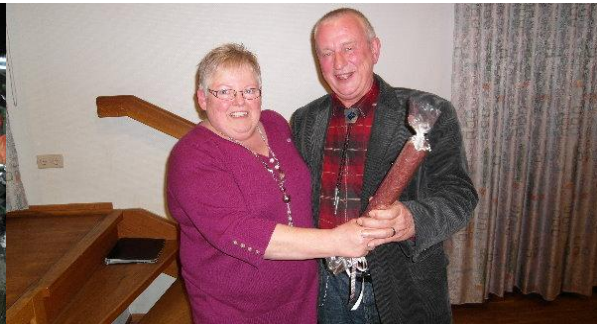
Auf der Jahreshauptversammlung des Eisenbahn-Chores Haste bekomme ich für meine Arbeit am Internetauftritt des Chores ein Präsent...