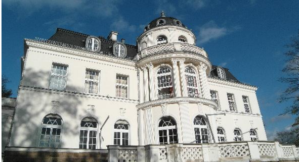
Wie so oft ein Wochenende in Bad Salzungen, Villa Dürkopp, Singen, Singen...