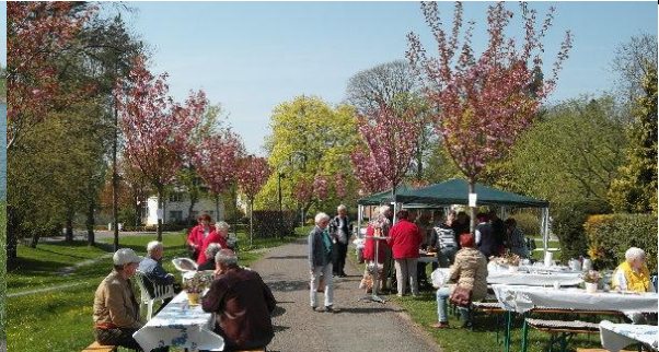
Kirschblütenfest in Stadthagen auf dem Wall der ehemaligen Stadtbefestigung