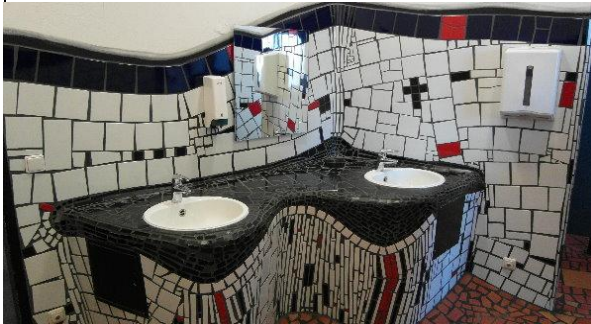
Der Hundertwasserbahnhof Uelzen, hier die Herrentoilette...