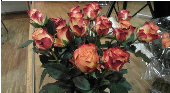
Diese schönen Rosen warten auf ihre Empfänger auf der Jahreshauptversammlung des Eisenbahnchores Haste...