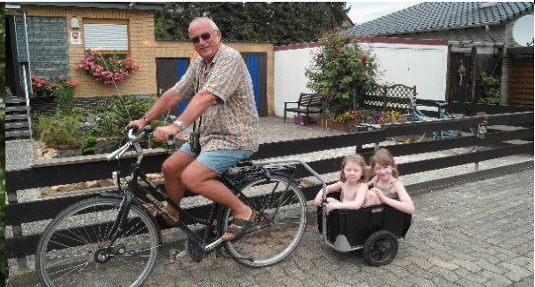
Die Enkelinnen meiner Nachbarn, ab geht es in die Eisdielen...