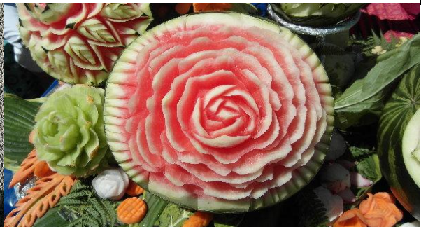
Buddafest in Hannover Ahlem, so schön kann man Melonen darstellen...