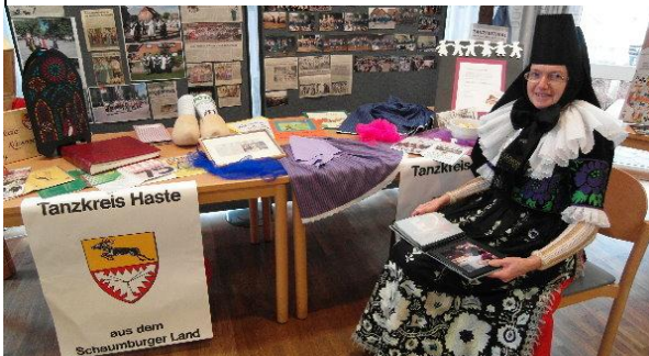
Die alljährliche Ausstellung der Haster Runde, mit viel Liebe werden hier historische Dinge gezeigt...