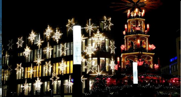
Weihnachtliche Dekoration in Hannover am Kröpcke...