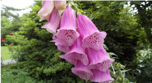
Digitalis, Fingerhut, immer wieder ein schöner Anblick und ein gutes Motiv...