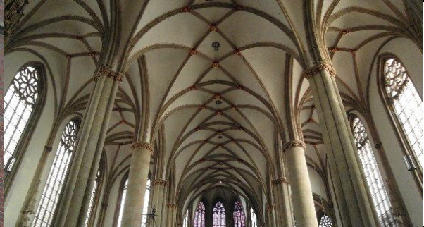
Das filigrane Rippenwerk in der Lambertikirche zu Münster...