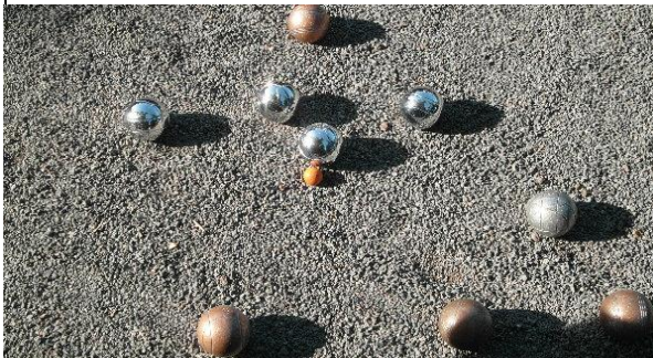
Boule, mit Begeisterung aber wenig Erfolg habe ich an einer Meisterschaft teilgenommen...