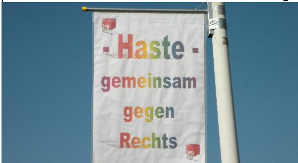
Jedes Jahr nehme ich in Bad Nenndorf an Aktionen gegen "rechts" teil...