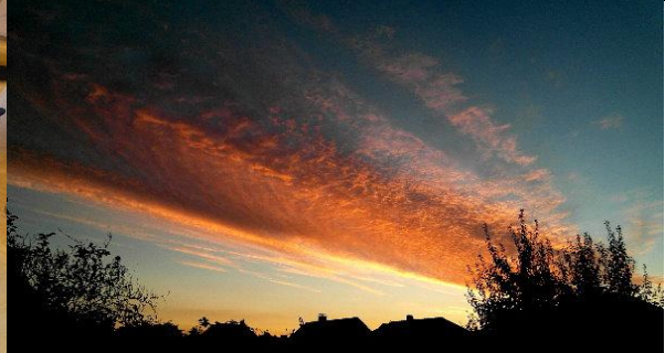
Der Himmel über Haste, schnell ein Photo gemacht...