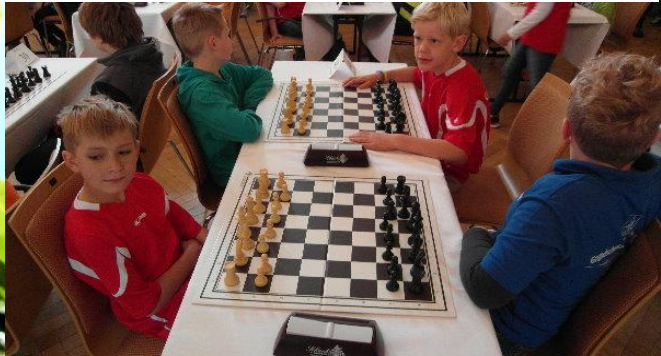
und wie jedes Jahr habe ich wieder mit drei Kindern aus meiner Schach AG an der Bückeburger-Schul-Schach Meisterschaft teilgenommen....