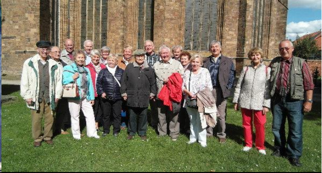
Ausflug mit den ehemaligen Kollegen der DB nach Verden, ich durfte die Organisation durchführen...