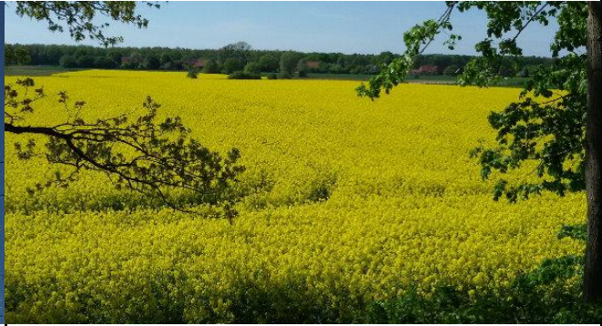
immer wieder eine Augenweide, der blühende Raps...