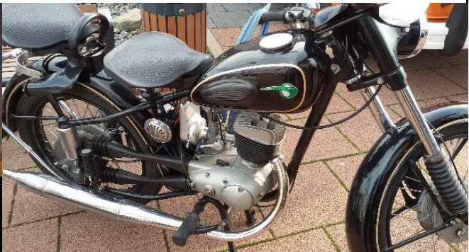
eine sehr alte MZ mit dem genialen Kettenschutz, wunderbar restauriert...