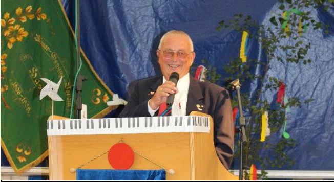
anlässlich des 110. Geburtstages des Eisenbahnchores-Haste durfte ich auf dem Kommerz die Moderation ausüben...