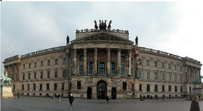
Panoramen, eines meiner Steckenpferde, hier die Schlossarkaden in Braunschweig...