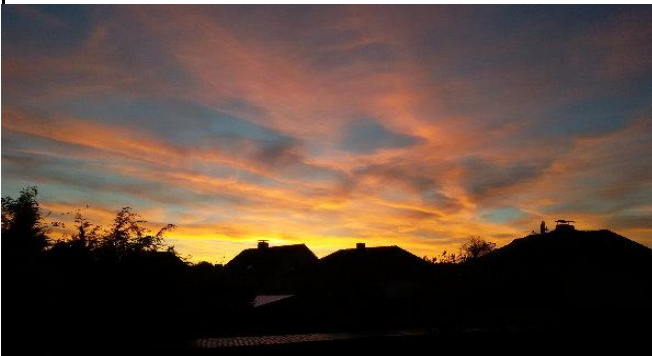
und immer wieder verlockt das Abendrot den Photoapparat zu benutzen...