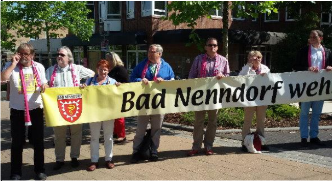
"Bad Nenndorf ist Bunt" und wehrt sich gegen Neonazidemstrationen, ich bin dabei...