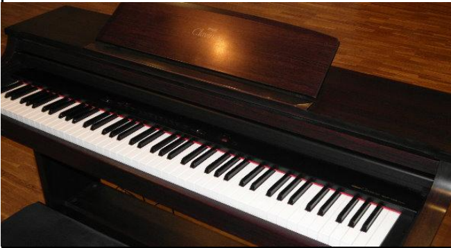
Das Klavier des Eisenbahnchores-Haste, Hansjürgen Lemme bespielt es gekonnt...