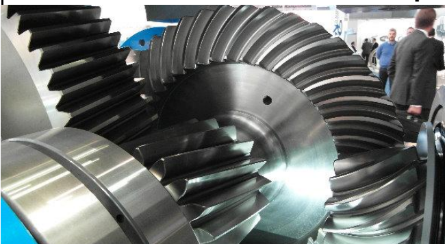
Industriemesse Hannover, ein hypoidverzahntes Kegelradgetriebe...