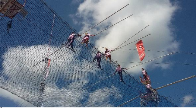
Hochseilartistik in Rodenberg, anlässlich des Stadtjubiläums...