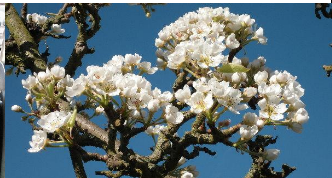
und als Kontrast der aufblühende Birnbaum im Garten...