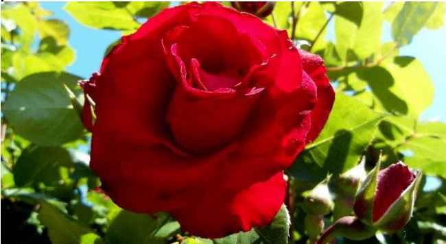
im Juni blühen die Rosen am schönsten...