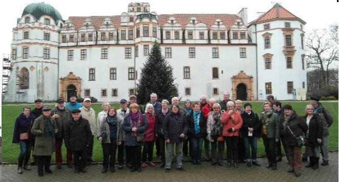
Das Schloss zu Celle mit den Freunden der AG 60+ des SPD Unterbezirkes Schaumburg...