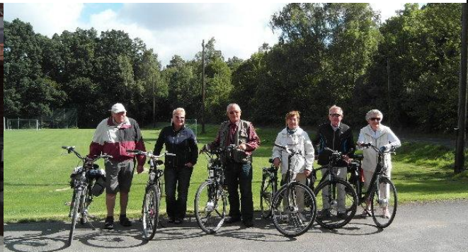
im Sommer organisiere ich jeweils drei Radtouren mit dem Eisenbahnchor-Haste...