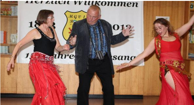
immer wenn mir danach ist, tanze ich mit schönen Frauen Bauchtanz, hier im Borken anlässlich eines Besuches des MGV Borken...