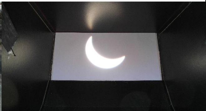
das Bild der partiell verfinsterten Sonne in meinem selbst gebauten Sonnenprojektor, man schaue auf www.astromedia.de ...