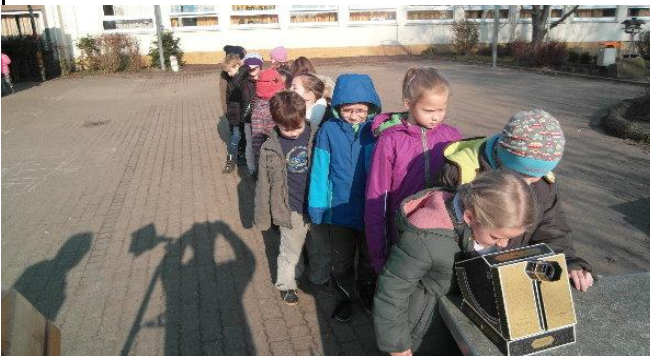
was gibt es schöneres als den Grundschulkindern mit einem Sonnenprojektor eine Sonnenfinsternis zu zeigen...